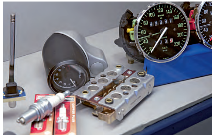
Namhaftes Zubehör und technische Verbesserung gehören zum Repertoire

konstante Qualität und, durch einen guten Draht zu BMW, schnelle Lieferung. Aber natürlich haben die Berliner ebenso bekannte Spezialisten im Portfolio, wie Magura oder Fehling. Ein besonderes Augenmerk richten sie dabei aufs Fahrwerk, von neuen Radlagern über Wirth-Gabelfedern bis zur besseren Abstimmung: „Als Stützpunkthändler von Wilbers haben wir alle Möglichkeiten, aus einer Gummikuh einen Jagdhund zu