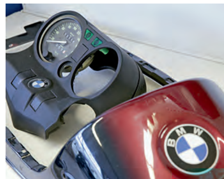
Originalteile von BMW bilden die Basis für Reparatur oder Restauration